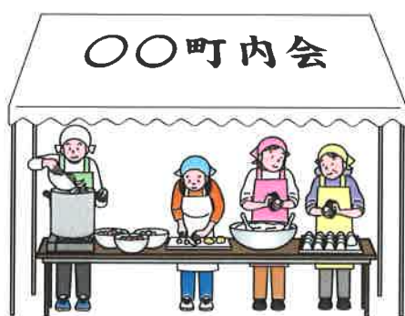
ご近所で楽しく炊き出し