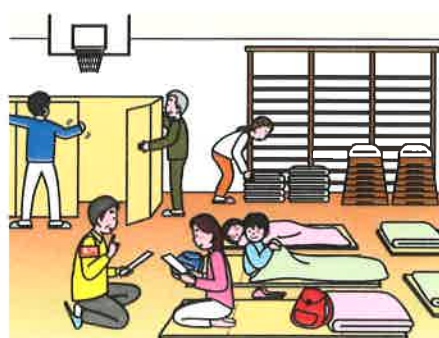
体験してみる避難所生活