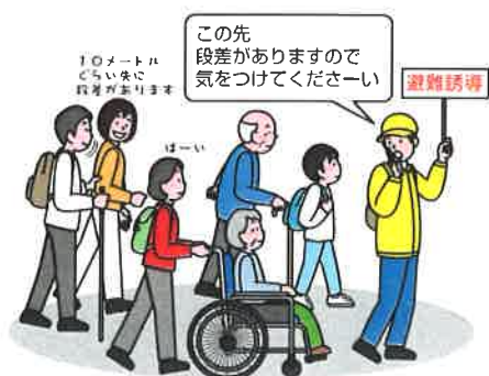
みんなで歩いて避難訓練